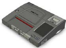
Machine à compilation ICP

Le superviseur du scrutin doit s'assurer que le rapport complet des résultats est retourné au bureau du directeur du scrutin avec la machine à compilation. L'agent de la machine à compilation des votes conserve la dernière (deuxième) section du rapport des résultats au cas où la machine serait abîmée au cours du trajet vers le bureau du directeur du scrutin.