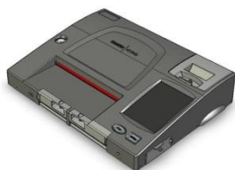
Machine à compilation ICP

Le superviseur du scrutin doit s'assurer que le rapport complet des résultats est retourné au bureau du directeur du scrutin avec la machine à compilation. L'agent de la machine à compilation des votes conserve la dernière (deuxième) section du rapport des résultats au cas où la machine serait abîmée au cours du trajet vers le bureau du directeur du scrutin.